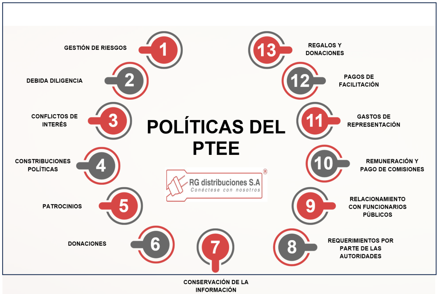
GRÁFICA 2: Políticas Manual PTEE

Las políticas establecidas en el presente manual contienen los lineamientos y directrices por los que deben guiarse las operaciones de RG DISTRIBUCIONES S.A. , con el propósito de hacer más efectiva la gestión de los riesgos de corrupción y soborno transnacional. La estructura de las políticas, son: