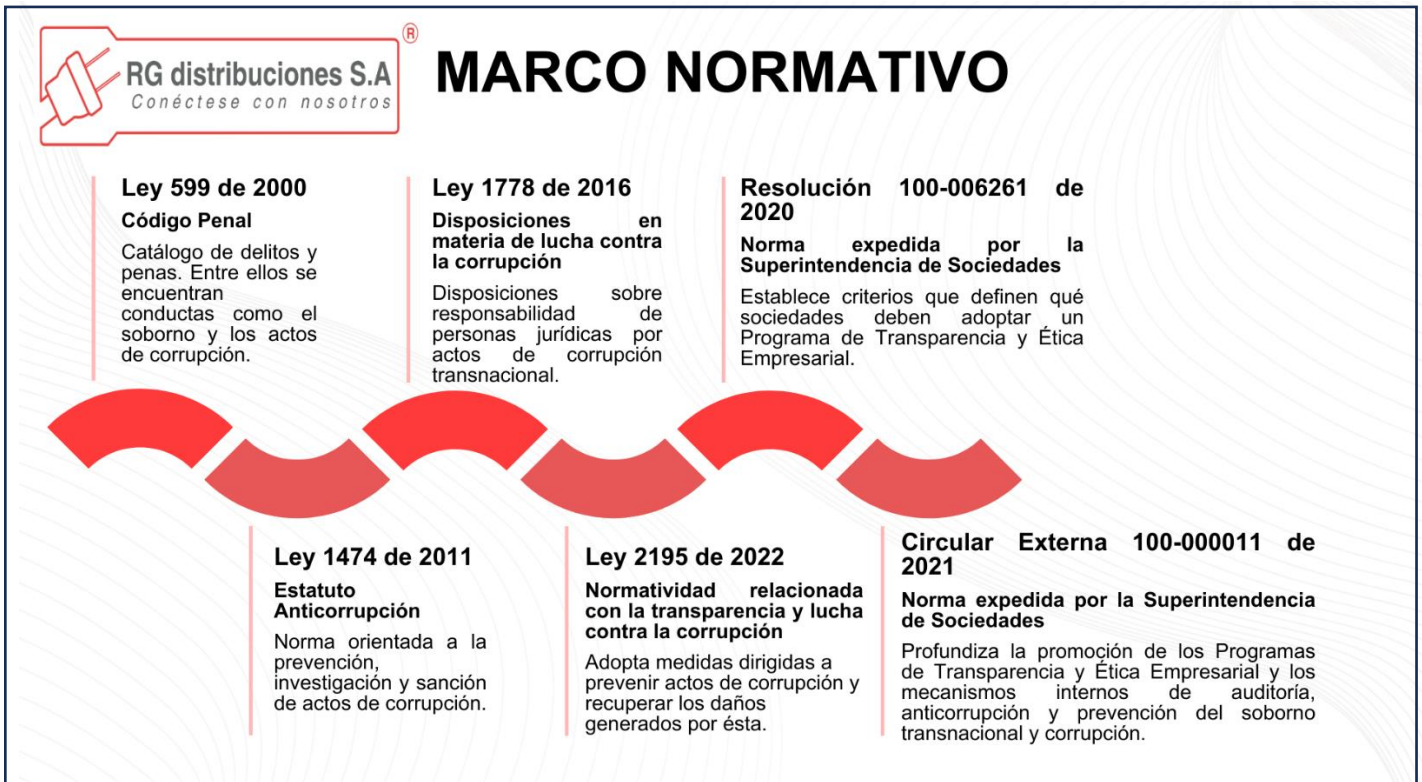
GRÁFICA 1: Marco Normativo

RG DISTRIBUCIONES S.A. acoge la normatividad vigente que rige la lucha contra la corrupción y el soborno transnacional en Colombia. En este sentido, las normas aplicables al presente PTEE son las siguientes: