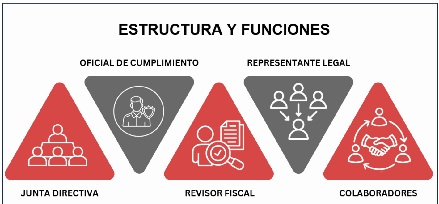
Gráfica 5: Estructura y Funciones.

Parte fundamental de la efectividad del presente PTEE se encuentra en la estructura y funciones que se le asignan a la Junta Directiva, el Representante Legal, el Oficial de Cumplimiento, el Revisor Fiscal, y los Colaboradores: